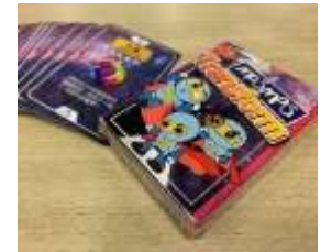
「MOSMPS Transform」 遊戲卡

這三年期間「E 課堂」的模式及課堂活動不斷優化，亦因著疫情多用了網上的聯繫。開心看見師生都喜歡及享受「E 課堂」，已達致「E 課堂」的初衷 Engage、Enrich 及 Explore，透過「陽光計劃」建立師生關係、團隊氣氛及學生個人品格，亦透過「探究計劃」建立學生的自主自學的探究精神。