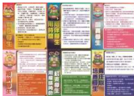
6A 品格教育教師提示卡